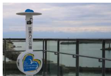
▲比美の江公園展望台のカメラスタンド